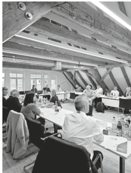
Auswahlgremium tagt zum 1. LEADER-Projektauftrag

Der nächste LEADER-Projektauftrag ist für den 2. September bis 21. Oktober 2024 geplant. Wer seine Ideen durchsprechen und auf Förderfähigkeit prüfen lassen möchte, kann sich gerne in der LEADER-Geschäftsstelle in Altshausen melden.