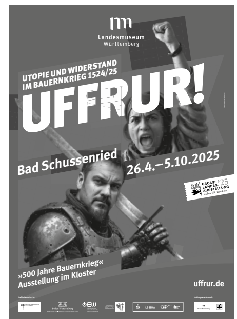
Plakat der GLA UFFRUR!, mit zwei Figuren aus der Ausstellung, die mithilfe von KI erstellt wurden

Weitere Informationen zur Großen Landesausstellung finden Sie unter: www.uffrur.de und www.landestmuseum-stuttgart.de