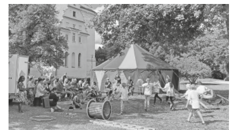
Pfingstferien in der Zirkusschule Moskito: In der zweiten Ferienwoche sind noch Betreuungsplätze frei.

Die Kosten belaufen sich auf 100 Euro pro Kind für vier Tage, ab dem zweiten Kind auf 50 Euro. Hinzu kommen jeweils 4,20 Euro pro Tag für das Mittagessen im ZfP-Personalcasino. Für Rückfragen oder eine verbindliche Anmeldung steht Ihnen Frau Cornelia Eberle unter Telefon 0751 7601-2798 oder per E-Mail unter cornelia.eberle@zfp-zentrum.de zur Verfügung. Anmeldungen sind bis spätestens 6. Mai 2024 möglich.