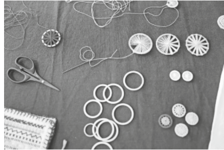
Bei der KinderWerkstatt am Sonntag, 28. April 2024 dreht sich im Museumsdorf mit einem kreativen Mitmachprogramm für die Kleinen und Vorführungen alles um „Garn und Faden“.