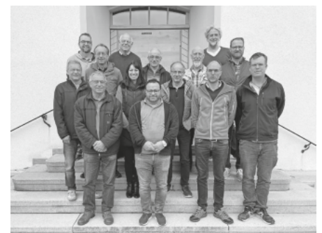
Die Kandidatinnen und Kandidaten der Bürgerlichen Wähler Liste:

orten vorstellen. In persönlichen Gesprächen geht es auch darum, zu erfahren, welche Themen für die Bürgerinnen und Bürger wichtig sind und welche Entwicklungen aus Sicht der Bad Schussenrieder Bevölkerung in den kommenden fünf Jahren vorangetrieben werden sollen.