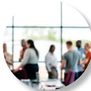
Achim Deinet Bürgermeister