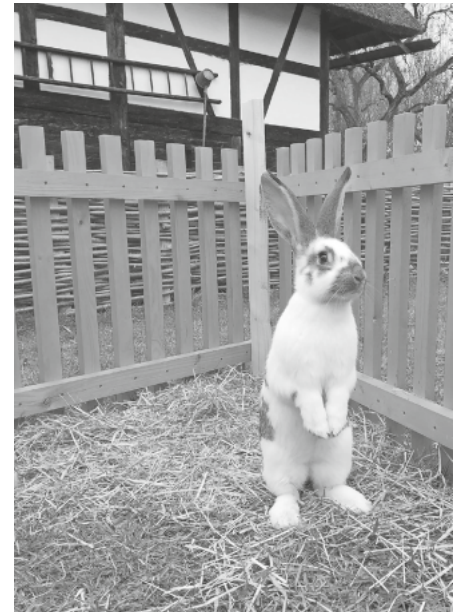
Am Ostermontag, 1. April können sich kleine und große Besucherinnen und Besucher im Museumsdorf Kürnbach von 10 bis 16 Uhr auf ein tolles Familienprogramm zum Mitmachen und Staunen freuen.

keiten aus dem Ofen des historischen Backhäusles, die Kürnbacher Vesperstube und Imbissstände locken mit schwäbischen Köstlichkeiten.