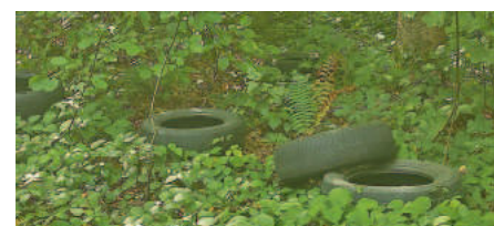
Ablagerung bei K 7558