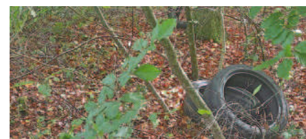
Ablagerung Langes Holz/Zellerseebreite