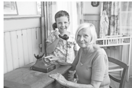
Beim FamilienSonntag am 30. Juli im Museumsdorf Kürnbach zeigen sich „Jung & Alt“ gegenseitig, was heute so geht und wie's früher geklappt hat.

Auch für das leibliche Wohl ist bestens gesorgt: Der Museumsbäcker holt köstliche Seelen, Dennete und mehr aus dem Ofen des historischen Backhäusles, das Team der Kürnbacher Vesperstube lockt mit schwäbischen Köstlichkeiten und das Café Andelfinger sorgt für süße Leckereien.